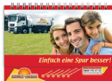
optional mit individuellem Deckblatt